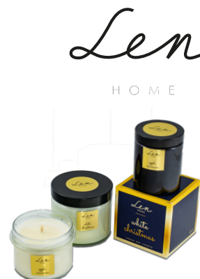
WEGAŃSKIE ŚWIECE SOJOWE NASZEJ PRODUKCJI