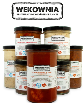
PRZETWORY Z WEKOWNI, PRODUKOWANE PRZEZ NASZYCH KUCHARZY