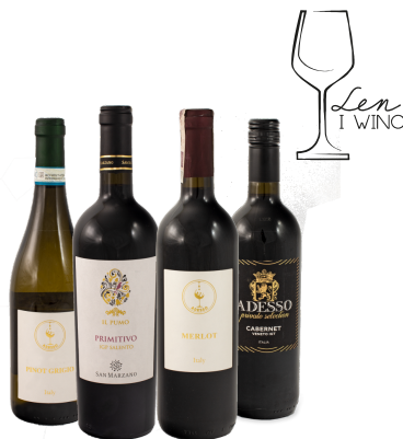
WINA Z NASZEGO SKLEPU „LEN I WINO”